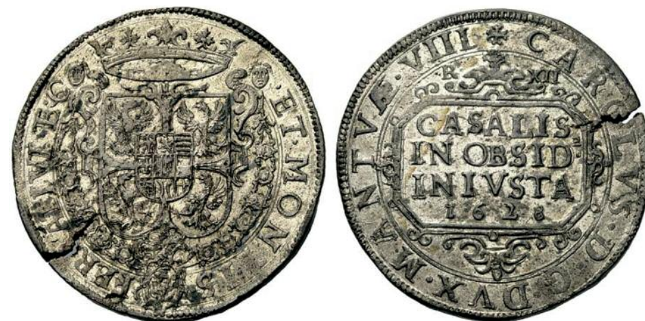
L'ingiusto assedio di Casale Monferrato "stigmatizzato" su un raro ducato in argento (mm 42; g 24,2) datato 1628 e recante le armi di Carlo Gonzaga-Nevers, futuro marchese.

zo II Gonzaga, per la successione mantovana da una parte si schierano il Sacro Romano Impero, la Spagna e i Savoia; dall'altra la Francia e Venezia, sostenuti dal papa che vorrebbero collocare sul trono del marchesato Carlo Gonzaga-Nevers. Questi, assediato a Casale dalle truppe sabaude e