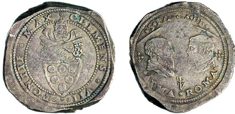
Benvenuto Cellini (1500-1571), con monete ossidionali del 1527: ducato d'argento (mm 35-37; g 36,55) battuto "in emergenza" entro le mura di Castel Sant'Angelo.

In altre situazioni le monete ossidionali narrano di sconfitte definitive e della fine di interi regni, principati e fiere autonomie cittadine. Negli anni dal 1555 al 1559, ad esempio, l'orgogliosa Repubblica di Siena occupata dai fiorentini si trasferisce "in esilio" – sorta di "guerra fredda" con i Medici – nella roccaforte di Montalcino. Qui,