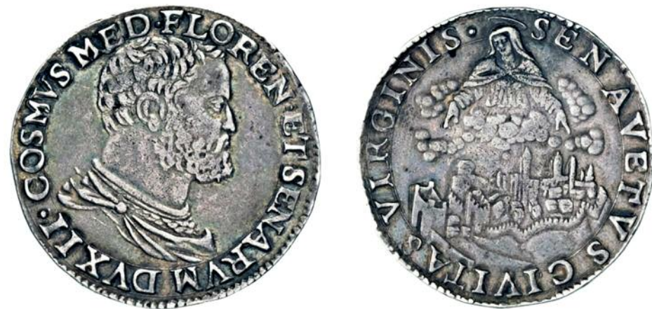
Il duca di Toscana Cosimo I ribadisce il dominio sulla città del Palio con un testone in argento (mm 31; g 9,20) su cui campeggia un marziale profilo corazzato e drappeggiato.

testoni e giuli in argento sui quali la turrata città, sotto il manto della Vergine, viene abbinata al suo ritratto in corazza o al noto stemma araldico dei Medici. È un secolo di fermenti e conflitti il Cinquecento, ai quattro angoli del bacino del Mediterraneo, e un decennio dopo la capitolazione senese è Venezia, la Serenissima, a subire un attacco dalle pesanti conseguenze per mano del sultano ottomano Selim II all'isola di Cipro. La guarnigione veneta di Nicosia si arrende rapidamente mentre la piazzaforte di Famagosta, contro ogni previsione, contrasta l'esercito ottomano per quasi un anno. In questo periodo il comandante veneziano Marcantonio Bragadin dà ordine di coniare un gran numero di bisanti ossidionali , utilizzati anche per pagare le truppe, promettendo che queste monete – in lega di rame – sarebbero state scambiate con altre d'oro in caso di una conclusione favorevole del conflitto. Di solito sono poco curate ed esteticamente non belle, le monete ossidionali , come in questo caso nel