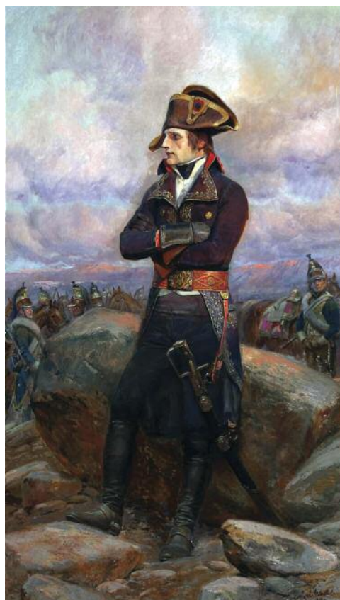
Edouard Detaille (1848-1912), Napoleone nel 1798 , 1908, olio su tela, collezione privata.

spagnole, nel 1628 ordina di coniare ducati e mezzi ducati in argento col proprio stemma e, al rovescio, un atto di accusa al nemico di fronte al mondo: CASALIS IN OBSIDE INIVSTA 1628 (Casale ingiustamente assediata). L'assedio si protrae e nel 1629-1630 le monete tornano a supportare la resistenza dei casalesi che culminerà nella pace di Cherasco e nell'ascesa al trono del Gonzaga-Nevers; bellissima e suggestiva – tra quelle coniate per la guarnigione francese – è una del valore di cinque fiorini, in rame, con lo scudo gigliato di Francia e al rovescio un trofeo d'armi e una sirena. Potente il significato delle immagini e delle parole latine che le accompagnano: NEC VI NEC FRAUDE (Casale non sarà presa, né con la forza né con l'inganno). È da ricordare un'altra città fortezza del Nord Italia, sia per le sue monete d'emergenza che per il fatto di essere rimasta inespugnata: Palmanova. Con la sua cinta di fortificazioni a pianta stellata, Palmanova riesce a fermare ogni velleità espansionistica dell'Austria e perfino dei