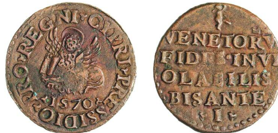
Rispecchia pienamente le difficoltà dell'assedio, questo bisante in rame (mm 25; g 5,403) emesso dai veneziani a Famagosta nel 1570.

quale non mancano né il leone alato di san Marco simbolo degli assediati né, al rovescio, un amorino a ricordare come, nell'antichità, proprio a Cipro sorgesse un famoso santuario in onore di Venere. La dura realtà vede le forze venete – inferiori a quelle ottomane per numero e armi e a corto di rifornimenti – costrette ad arrendersi nell'agosto del 1571. Secondo i termini della resa, a Bragadin è garantito un salvacondotto ma il pasha ottomano Lala Kara Mustafa, rinnegando l'accordo, fa imprigionare e scuoiare vivo il governatore veneziano. La pelle del difensore di Famagosta, impagliata, viene inviata al sultano come macabro trofeo, mentre Venezia, senza immaginare ancora il riscatto di Lepanto, è scioccata e piange la perdita di uno dei suoi possedimenti nodali, sia dal punto di vista della posizione geografica che sotto il profilo militare e commerciale. Strategici, del resto, in uno scenario geopolitico frammentato e fluido come la penisola e in un'epoca di lotte tra i grandi d'Europa – Francia, Austria e Spagna su tutti