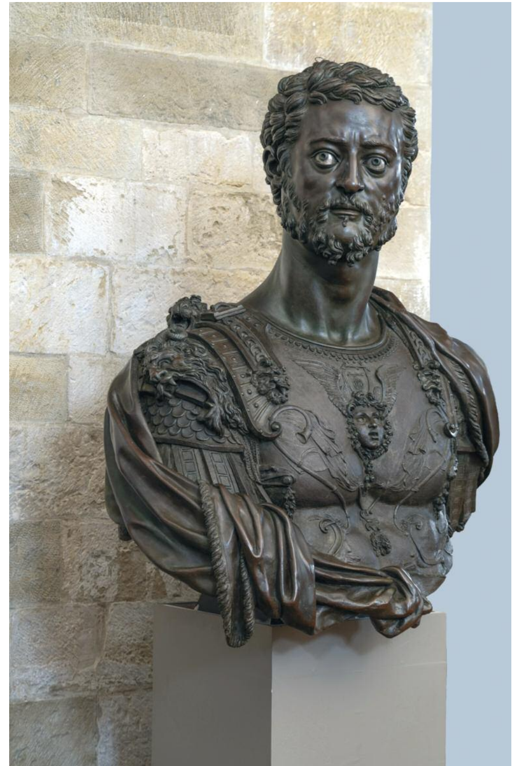
Benvenuto Cellini, busto di Cosimo I de' Medici, 1545 e il 1548, bronzo e argento, Firenze, Museo del Bargello.