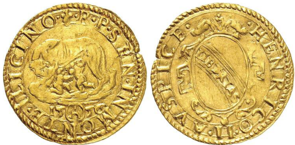
La Repubblica di Siena in esilio a Montalcino conia nel 1556, sotto la protezione francese, un prezioso scudo in oro (mm 20-21; g 3,32) con i simboli della propria autonomia.

sotto protezione francese, il governo senese batte le sue ultime monete all'insegna della lupa, del motto LIBERTAS e dell'esplicito riferimento al sovrano transalpino che recita HENRICO II AVSPICE ; sul fronte opposto il duca Cosimo I, il vincitore che paziente aspetta la definitiva capitolazione, risponde facendo coniare