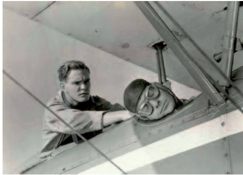
Fotogramma dal primo cliffhanger serial dedicato a Tailspin Tommy di Lew Landers, 1934.

sce eccezionalmente negli Stati Uniti a partire dalla metà degli anni trenta del secolo scorso. Se negli oltre tre lustri che vanno dal 1915 al 1932 si contano quindici pellicole live action della durata non inferiore ai quaranta minuti (dunque, in media, meno di un film all'anno), le cose cambiano sensibilmente dal 1934 in poi. Il film che rappresenta una sorta di spartiacque tra queste due distinte fasi è Tailspin Tommy di Lew Landers, tratto dall'omonima strip di Glen Chaffin e Hal Forrest, avente per epónimo protagonista uno spericolato pilota di aeroplani. L'importanza di Tailspin Tommy (ci riferiamo alla pellicola, non alla striscia) consiste nell'essere il primo esempio mai realizzato di cliffhanger serial ispirato a un fumetto. Prima di soffermarci sui cliffhanger serials è d'obbligo presentare un po' di storia dei serial cinematografici tout court. La formula del serial (ovvero uno spettacolo frammentato in diverse puntate, proposte al pubblico a intervalli di tempo regolari) viene sperimentata per la prima volta negli Stati Uniti nel 1912, quando la rivista «McClure's Ladies World» decide di ospitare su ogni numero, per aumentare le vendite, un racconto dedicato a un personaggio femminile le cui gesta sarebbero