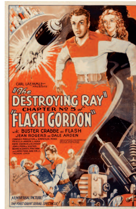
Flash Gordon , 1936, diretto da Frederick Stephani, con Buster Crabbe nella parte del protagonista.

poi state narrate, sempre a episodi, anche dal cinema. Grazie all'interessamento della Edison Company, società produttrice del film, il progetto, denominato What Happened to Mary , va in porto e si rivela subito un clamoroso successo. Da quel momento, inevitabilmente, ha inizio una fioritura di serial che coinvolgerà anche paesi europei quali la Francia e la Germania. Se i primi serial muti erano incentrati quasi esclusivamente su giovani eroine, a partire dagli anni venti cominciano a mettersi in evidenza anche diversi interpreti di sesso maschile, il che non impedirà un rapido (ancorché provvisorio) declino della formula seriale, vittima al contempo di un eccesso di offerta che aveva generato stanchezza nel pubblico, e di una indubbia maturazione degli spettatori non più at-