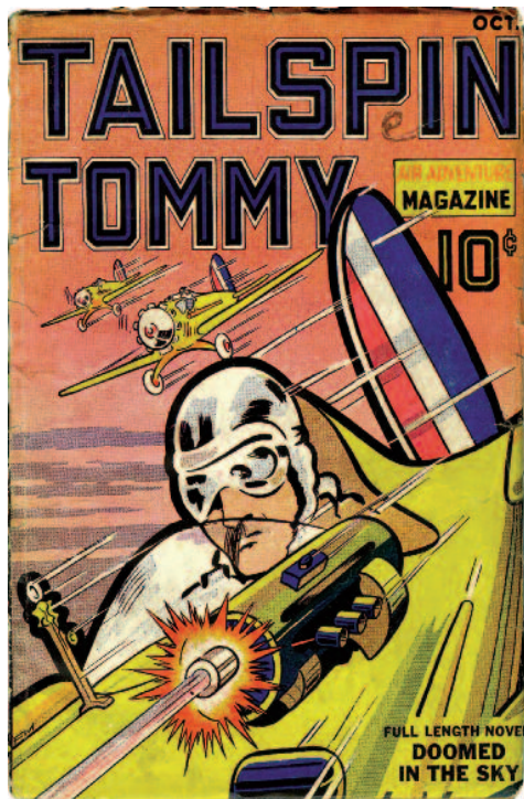
Tailspin Tommy , 1 ottobre 1936, creato da Glen Chaffin con i disegni di Hal Forrest.

sce eccezionalmente negli Stati Uniti a partire dalla metà degli anni trenta del secolo scorso. Se negli oltre tre lustri che vanno dal 1915 al 1932 si contano quindici pellicole live action della durata non inferiore ai quaranta minuti (dunque, in media, meno di un film all'anno), le cose cambiano sensibilmente dal 1934 in poi. Il film che rappresenta una sorta di spartiacque tra queste due distinte fasi è Tailspin Tommy di Lew Landers, tratto dall'omonima strip di Glen Chaffin e Hal Forrest, avente per epónimo protagonista uno spericolato pilota di aeroplani. L'importanza di Tailspin Tommy (ci riferiamo alla pellicola, non alla striscia) consiste nell'essere il primo esempio mai realizzato di cliffhanger serial ispirato a un fumetto. Prima di soffermarci sui cliffhanger serials è d'obbligo presentare un po' di storia dei serial cinematografici tout court. La formula del serial (ovvero uno spettacolo frammentato in diverse puntate, proposte al pubblico a intervalli di tempo regolari) viene sperimentata per la prima volta negli Stati Uniti nel 1912, quando la rivista «McClure's Ladies World» decide di ospitare su ogni numero, per aumentare le vendite, un racconto dedicato a un personaggio femminile le cui gesta sarebbero