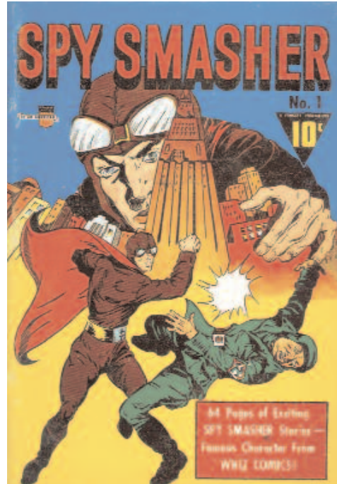
Fumetto di Spy Smasher , 1942; in basso, locandina del cliffhanger serial di Don Winslow of the Navy, 1941.

L'excursus dedicato agli spy fumetti prosegue con i cliffhanger serials, espediente narrativo che interrompeva temporaneamente la vicenda in un momento di particolare tensione. La prima trasposizione cinematografica di cliffhanger seriale fu Tailspin Tommy (1934), il cui protagonista era uno spericolato pilota. Sull'onda del successo gli fu dedicato il nuovo serial The Great Air Mystery (1935). Fu poi la volta di Flash Gordon (1936), cui seguirà una lunga teoria di film a puntate ricavati dalle vicende di Jungle Jim, Dick Tracy, Mandrake, Secret Agent X-9, Superman, Batman e Captain America. Tra le serie che si misurarono con il genere spionistico, degna di nota è quella centrata sul fumetto di Spy Smasher (1942), un agente che dispone di strabilianti mezzi tra i quali un avveniristico veicolo, fusione tra un aeroplano, un'automobile e un sottomarino.