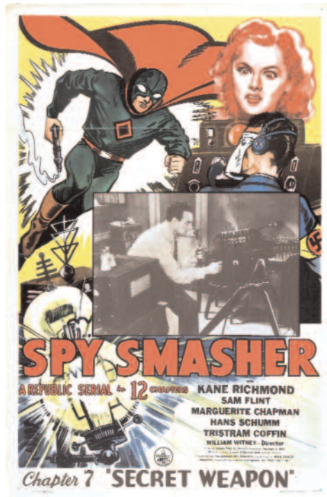
Locandina del cliffhanger serial di Spy Smasher , 1942.