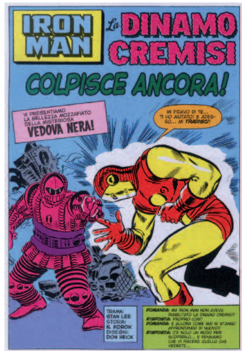
Tavola di apertura dell'episodio di Iron Man, «La Dinamo Cremisi colpisce ancora!» (aprile 1964).

La popolarità e il gradimento di pubblico che caratterizzano il genere spionistico sono tali da rendere non raro imbattersi in fumetti che toccano il tema dell'intelligence pur appartenendo ad altri filoni. In misura maggiore o minore, è il caso delle opere trattate in questa dodicesima puntata della nostra rubrica. Iron Man è un fumetto supereroistico in cui non mancano le atmosfere da spy story, non foss'altro che per i modi alla James Bond del protagonista della serie, il miliardario americano Tony Stark. Petra Chérie è un'avventuriera franco-polacca, abile aviatrice che, offrendo il proprio supporto agli alleati franco-inglesi durante la Prima guerra mondiale, non può non far pensare alla leggendaria Mata Hari. XIII è un'avvincente saga in cui, tra complotti, trappole e tradimenti, si narra il tentativo di un uomo che ha perso la memoria di scoprire quale sia la sua vera identità. Suicide Squad, infine, ci fa tornare nel mondo dei supereroi, ma in una maniera decisamente originale e raccontando – spesso con abbondanti dosi di acido umorismo – di rischiosissime missioni segrete.