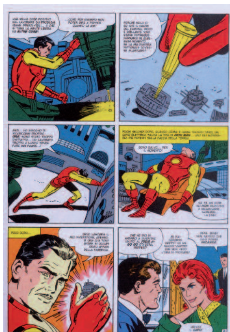
Da sinistra, tavola tratta da «La Dinamo Cremisi colpisce ancora!»; a destra, tavola tratta dall'episodio di Iron Man «Anche gli eroi muoiono!» (ottobre 1969).