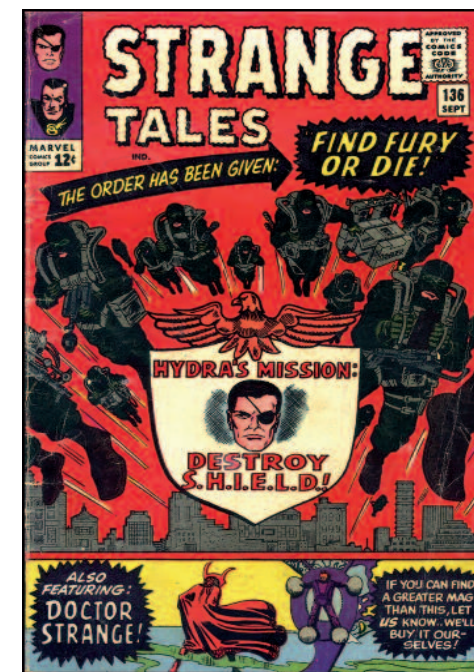
Copertina del n. 136 di Nick Fury (1965).

Finora ci siamo sempre occupati di fumetti che hanno nello spionaggio il proprio tema centrale. Essendo però quello spionistico, fin dal suo primo apparire, un genere estremamente popolare, non sono rare le opere fumettistiche che lo frequentano con una certa regolarità pur battendo anche – quando non prevalentemente – altri filoni.