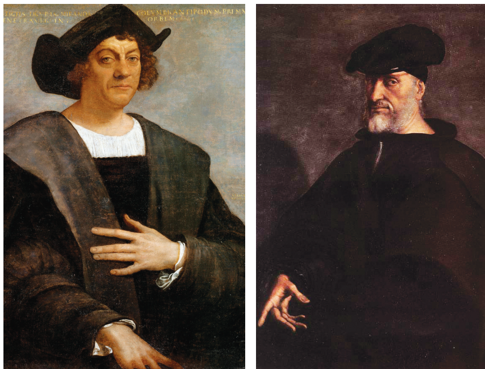
Sebastiano del Piombo (1485-1547). A sinistra: Ritratto di Cristoforo Colombo , 1519, Metropolitan Museum of Art, New York, particolare; a destra: Ritratto di Andrea Doria , 1526, Villa del Principe, Genova, particolare. Nella p. successiva: Antonio de Brugada (1804-1863), La batalla de Lepanto , Museu Maritim de Barcelona.

poeta spagnolo Francisco de Quevedo y Villegas viene «seppellito» l'oro proveniente dalle Indie. Una stagione irripetibile – segnata anche dal contributo delle galee di Gianandrea Doria alla vittoria della battaglia di Lepanto, il 7 ottobre 1571, decisiva per contrastare l'espansione degli ottomani in Europa – di cui rimangono fulgide testimonianze come i Rolli, i palazzi delle famiglie patrizie riconosciuti dall'Unesco nel 2006 come Patrimonio dell'Umanità. Il declino della città inizia dalla seconda metà del Seicento, quando l'impovertimento della Spagna e la conseguente progressiva perdita d'influenza nello scacchiere internazionale e sulle principali rotte commerciali e marittime mondiali ne segnano il tramonto come grande potenza finanziaria. Non è un caso che ciò avvenga quando Genova comincia a perdere il controllo del mare, attorno al quale, storicamente, si giocano le sue fortune e sfortune. Dal mare arriva la grande peste che nel 1630 e nel 1656-1657 ne decima la popolazione, causando la morte di oltre 100mila persone. E sempre dal mare arrivano i bombardamenti della flotta di Luigi XIV, che nel 1684 acuiscono una crisi che è insieme politica ed economica.