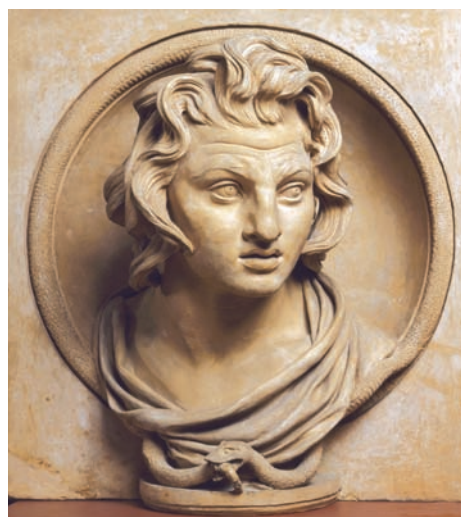
Vincenzo Gemito (1852-1929), Alessandro Magno , 1920-1925, marmo, Galleria nazionale d'arte moderna e contemporanea, Roma.

lasciatisi alle spalle il monte presso le Porte dette Amaniche, [il Gran Re] avanzò verso Isso e arrivò alle spalle di Alessandro senza che questi se ne avvedesse. Impadronitosi di Isso, catturò un certo numero di Macedoni lasciati indietro perché malati, che fece uccidere dopo crudeli torture; il giorno dopo avanzò verso il fiume Pinaro (ARRIANO, Anabasi di Alessandro II , 7, 1-2).