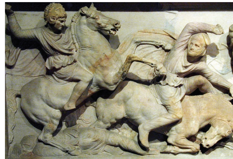
Cavalieri eteri , particolare dal sarcofago di Alessandro Magno, Museo archeologico, Istanbul. Gli eteri, i "compagni", erano membri degli squadroni di cavalleria pesante tra i quali venivano scelti anche i somatophylakes , le guardie del corpo del sovrano.

mico era accampato in forze nella valle del Pinaro, e nel primo pomeriggio «gli eteri riferirono ad Alessandro che Dario era a portata di mano» (ARRIANO, Anabasi di Alessandro II , 7, 2). La «nebbia della guerra» (Carl von Clausewitz), che aveva occultato a lungo i movimenti di Dario, si era finalmente dissolta. L'indomani ci sarebbe stata battaglia.