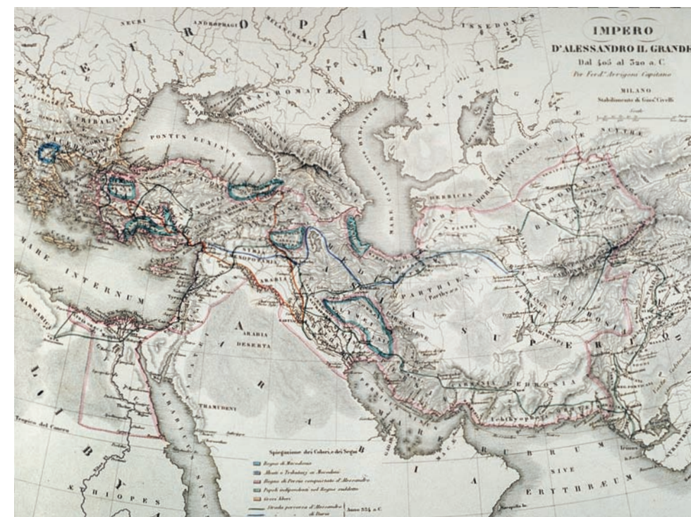
L'Impero di Alessandro Magno, con gli itinerari percorsi da lui, Dario e Senofonte dal 405 al 320 a.C. Carta tratta dall' Atlante di geografia universale statistica e pittoresca illustrato da G. Marmocchi , edizioni Civelli, Milano 1858.

«Indiam quaeris Indis quoque ignotam»... l'espressione di Curzio Rufo è davvero di rara efficacia. Possiamo dubitare che il valoroso Ceno abbia usato queste precise parole, nondimeno sono così adatte alla situazione che è probabile conservino almeno il senso di quelle originali. I macedoni erano andati troppo oltre verso l'ignoto: non poteva esserci alcun tipo di Humint capace di penetrare nella tenebra che avevano di fronte, scacciando le paure che avvelenavano gli animi logorati da troppi anni di guerra. Non lo avrebbero più seguito per raggiungere il sorgere del sole. Alessandro, furioso, si chiuse per due giorni nella sua tenda; ne uscì il terzo, rassegnato, e diede ordine di costruire 12 altari in pietra, di ampliare le fortificazioni del campo e persino di lasciare indietro giacigli più grandi di quelli necessari agli uomini comuni. Gli indiani avevano spaventato i suoi con false notizie: prima di prendere la via del ritorno intendeva ripagarli con la stessa moneta, «allestendo per i posteri un falso portento» (CURZIO RUFO, Storie di Alessandro Magno IX, 3, 19). Alessandro guidò i suoi lungo la via nota fino all'Hydaspes. La grande avventura iniziava a ripiegarsi su sé stessa. Negli ultimi giorni la raccolta d'informazioni e il loro impatto sul morale degli uomini erano stati determinanti: la conoscenza di difficoltà e pericoli, veri o immaginari, non aiuta a conquistare il mondo.