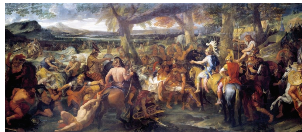
Charles Le Brun (1619-1690), Alessandro e Poro, 1673 .

Ad Alessandro, sempre secondo Curzio Rufo, le cifre fornite da Fegeo parvero inverosimili: chiese quindi a Poro, che lo accompagnava nell'avanzata verso Oriente, di confermarle. Poro gli disse che, a suo avviso, Fegeo non aveva esagerato, aggiungendo alcune informazioni interessanti sulla situazione dinastica del re dei gangaridi, uomo di bassa estrazione sociale giunto al potere grazie al padre, a sua volta capace di sedurre la regina locale e poi colpevole di averne eliminato i discendenti diretti. C'era quindi la possibilità che la sua autorità sovrana non fosse tanto salda da resistere a un attacco diretto, e che tra i sudditi si potessero trovare degli elementi disposti a collaborare. Alessandro prese probabilmente nota delle informazioni ricevute ma, come suo solito, non si preoccupò granché della forza militare del nemico, né dei suoi elefanti, dei quali aveva già compreso la scarsa efficacia tattica di fronte a un'armata organizzata e addestrata come la sua. Temeva però, sempre secondo Curzio Rufo, «la natura dei luoghi e l'irruenza dei fiumi»; e forse lo spazio, che sembrava continuare ad ampliarsi a dismisura. La valutazione fornita da Fegeo riguardo la distanza da percorrere per raggiungere «il maggior corso d'acqua di tutta l'India» era sostanzialmente corretta: tra l'Ifasi all'altezza della città di Jalandhar e l'alto corso del Gange, infatti, ci sono circa 320 km, che