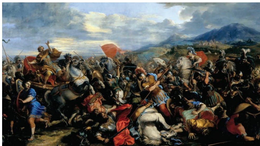
Jacques Courtois (1621-1676), La battaglia di Gaugamela del 331 a.C. Lo scontro avvenne nei pressi dell'odierna città di Mosul (Iraq) tra l'esercito di Alessandro Magno e quello persiano di Dario III. Anche se in inferiorità numerica, Alessandro uscì vittorioso grazie alle sue superiori tattiche e alle truppe meglio addestrate.

Alessandro, avendo sentito che i barbari avevano deciso di viaggiare di notte, chiese agli abitanti se conoscessero una scorciatoia per arrivare addosso ai fuggitivi. Essi dissero che la conoscevano, ma che la strada era abbandonata per mancanza d'acqua. Alessandro ordinò lo stesso di guidarlo lungo quell'itinerario (ARRIANO, Anabasi di Alessandro III , 21, 7).